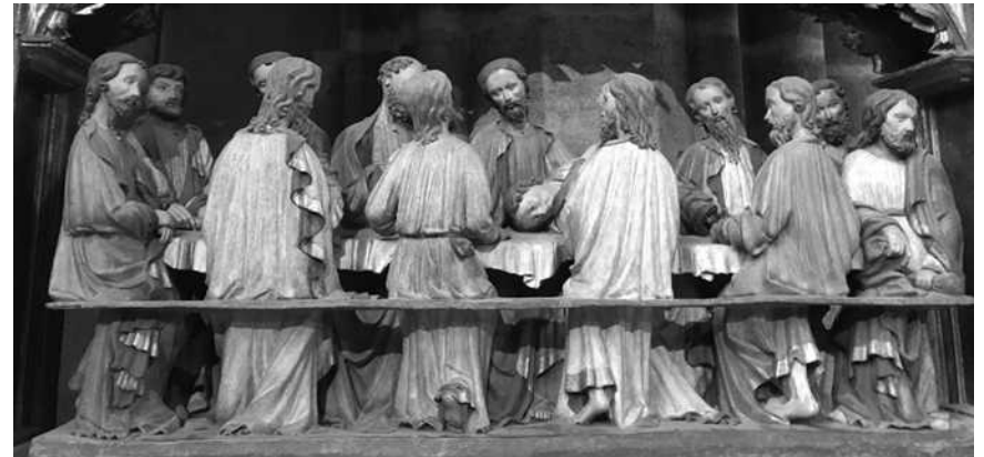
Abendmahlsszene. Seitenaltar in St. Lorenz, Nürnberg

Mittwoch, am 18.03. | 22.04. | 27.05. und 17.06. jeweils 20 bis 21.30 Uhr. Theologische Vorkenntnisse werden nicht vorausgesetzt!